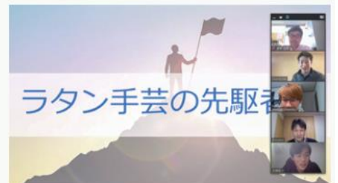
消費者向け商品の開発可能性を探る