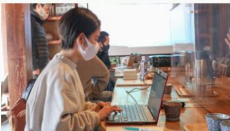
採用専門ページの企画・制作