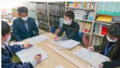
高校生に地元企業を知ってもらうイベント企画