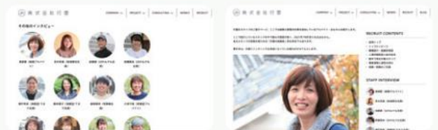
企画制作した採用専門ページ